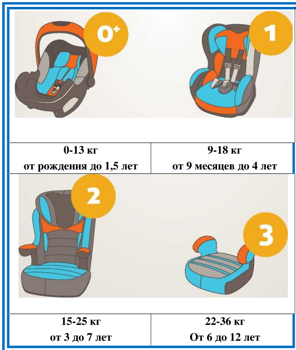
Рисунок 1. Виды детских удерживающих устройств.

Позиция Госавтоинспекции заключается в том, что ребенка в возрасте от 8 до 12 лет как можно дольше надо перевозить в автомобиле именно с использованием детского удерживающего устройства, обеспечивая тем самым наиболее безопасные условия перевозки.