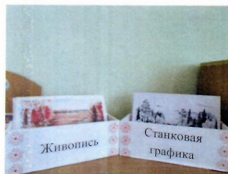
Картины художника в мини - музее