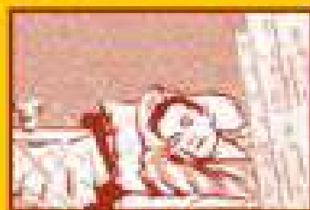
Избегайте контактов с заболевшими