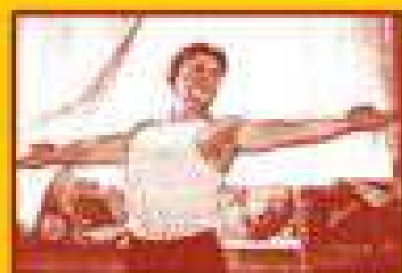
Ведите здоровый образ жизни