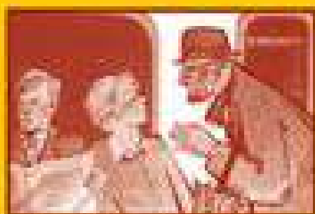
Ограничьте пребывание в местах скопления людей