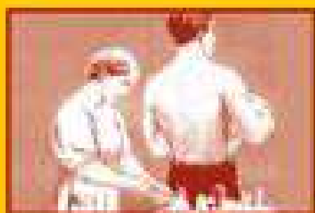
Сделайте прививку от гриппа