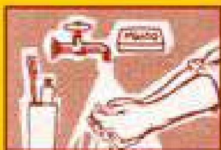
Регулярно мойте руки