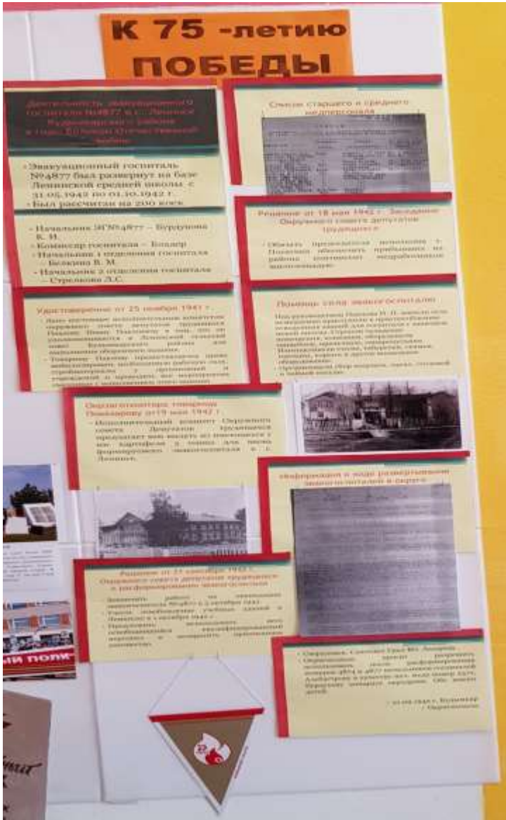
Информация об эвакогоспитале