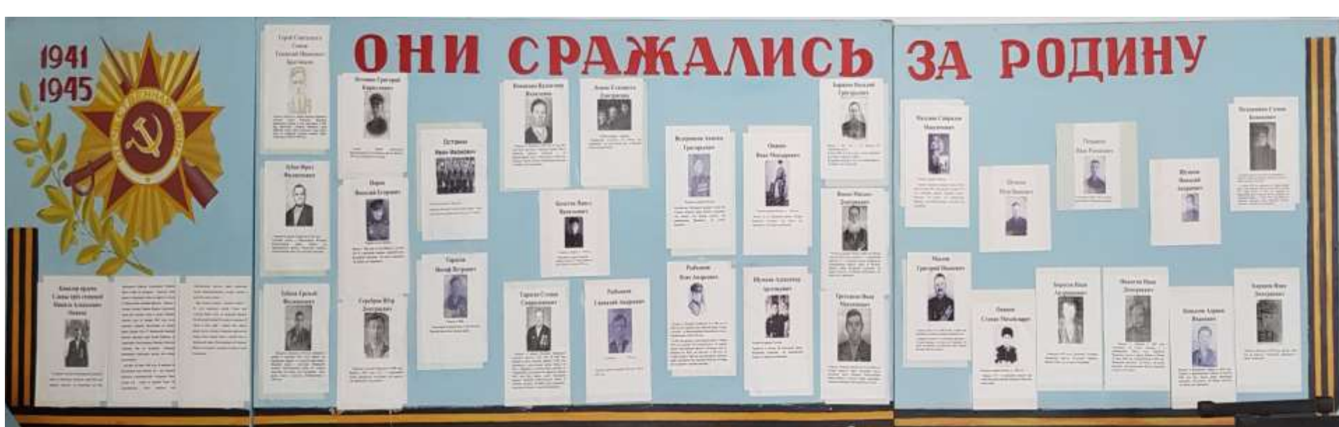
Экспозиция «Бессмертный полк»